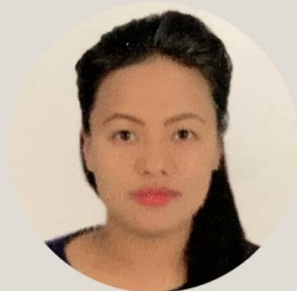
Banu Ale Magar Documentation